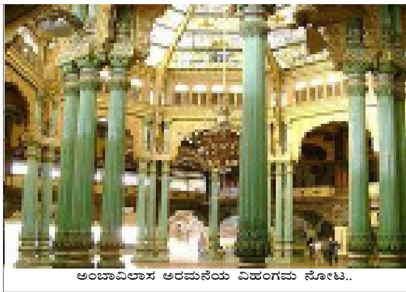
ಅಂಬಾವಿಲಾಸ ಅರಮನೆಯ ವಿಹಂಗಮ ನೋಟ..

ಅರಮನೆಯ ಒಳಾಂಗಣದಲ್ಲಿ ಪ್ರಮುಖವಾಗಿ ಎರಡು ಭಾಗಗಳಿವೆ, ಒಂದು ಸಮಾರಂಭಕ್ಕೆ ಮೀಸಲಾಗಿಸಿದರೆ ಮತ್ತೊಂದನ್ನು ನಿವಾಸಕ್ಕೆ ಮೀಸಲಿಡಲಾಗಿದೆ, ನೆಲಮಾಳಿಗೆಯ ಪೂರ್ವದ ಅರ್ಧ ಭಾಗದಲ್ಲಿ ಸಮಾರಂಭದ ಕೊಠಡಿಗಳಿದ್ದು ಅವುಗಳನ್ನು ಗೊಂಬೆ ತೊಟ್ಟಿಯನ್ನು ದಸರಾ ಹಬ್ಬದ ಸಮಯದಲ್ಲಿ ಗೊಂಬೆಗಳ ಪ್ರದರ್ಶನಕ್ಕಾಗಿ ಬಳಸಿಕೊಳ್ಳಲಾಗುತ್ತದೆ. ಯುರೋಪಿಯನ್ ಮಾದರಿಯ ಅಮೃತ ಶಿಲೆಯಿಂದ ಮಾಡಲ್ಪಟ್ಟ ಶಿಲ್ಪಗಳೂ, ಹಳೆಯ ಅರಮನೆಯ ಮರದ ಮಾದರಿಗಳು, ಭಾರತೀಯ ಮಾದರಿಯ ಅಮೃತ