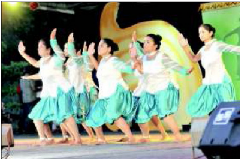
ಬಯಲು ರಂಗಮಂದಿರದಲ್ಲಿ ನಡೆದ ಯುವ ದಸರಾ ಸಂಭ್ರಮದ ಸಮಾರೋಪ ಸಮಾರಂಭಕ್ಕೆ ನೃತ್ಯದ ಇತಿಶ್ರೀ.

ಪ್ರಸ್ತುತ ಇವರು ಮೈಸೂರು ವಿಶ್ವ ವಿದ್ಯಾನಿಲಯದ 'ವಿವಿ' ಗಂಗೋತ್ರಿಯ ಅರ್ಥಶಾಸ್ತ್ರ ವಿಭಾಗ 'ದಲ್ಲಿ ಸ್ನಾತಕೋತ್ತರ ಪದವಿಯನ್ನು ಓದುತ್ತಿದ್ದಾರೆ. ಇವರು ಕಮ್ಮಿ ಸ್ಯಾಕ್ಸೋಫೋನ್ ವಾದನದಲ್ಲಿ ವಿವಿಧ ರೀತಿಯ ಪ್ರಯೋಗಗಳನ್ನು ಮಾಡುತ್ತಾ ಬಂದಿರುತ್ತಾರೆ, ಸ್ಯಾಕ್ಸೋಫೋನ್ 'ಪ್ಯೂಜನ್', ಸ್ಯಾಕ್ಸೋಫೋನ್ 'ಜುಗಲ್ಬಂದಿ', ಹೀಗೆ ಮುಂತಾದ ಹೊಸ ಪ್ರಯತ್ನ