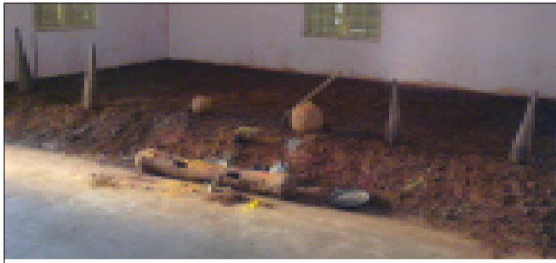
ಗರಡಿ ಮನೆಯ ಒಳಾಂಗಣದ ಒಂದು ಸ್ಥೂಲ ನೋಟ

ಗರಡಿ ಮನೆ ಎಂಬುವುದು ಸಾಮಾನ್ಯವಾದ ಸ್ಥಳವಾಗಿರಲಿಲ್ಲ,