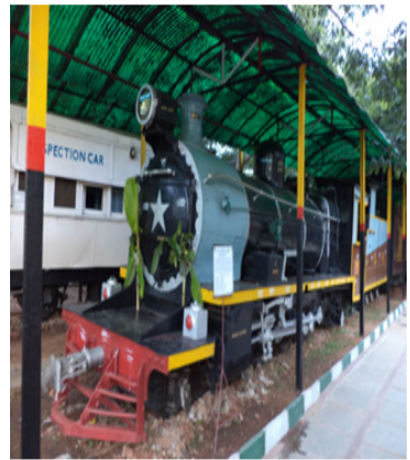
ರೈಲು ನಿಲ್ದಾಣಕ್ಕೆ ಅಂಟಿಕೊಂಡಂತೆಯೇ ಈ ವಸ್ತು ಸಂಗ್ರಹಾಲಯವು ಇದೆ.

ಅಭಿವೃದ್ಧಿ ಪಥದಲ್ಲಿ ಸಾಗುತ್ತಿರುವ ಭಾರತೀಯ ರೈಲು ಸಾರಿಗೆಯ ನೂರೈವತ್ತು ವರ್ಷಗಳ ಕಥನವನ್ನೇ ಮೈಸೂರಿನ 'ರೈಲು ಸಂಗ್ರಹಾಲಯ' ತೆರೆದಿಡುತ್ತದೆ. ಮೈಸೂರು