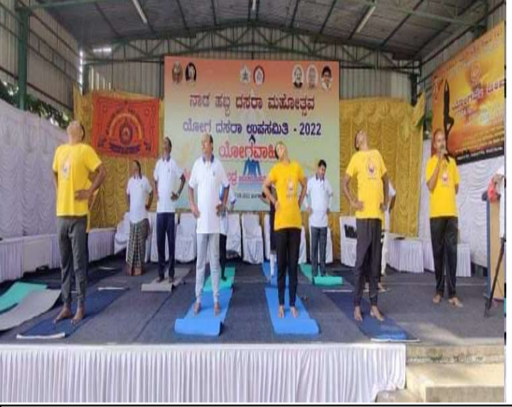
ನಾಡ ಹಬ್ಬ ದಸರಾ ಮಹೋತ್ಸವದ ಯೋಗ ದಸರಾ ಉಪಸಮಿತಿವತಿಯಿಂದ ಹಮ್ಮಿಕೊಂಡಿದ್ದ ಯೋಗವಾಹಿನಿ ಶಿಬಿರದಲ್ಲಿ ಯೋಗ ಮಾಡುತ್ತಿರುವ ಯೋಗಪಟುಗಳು