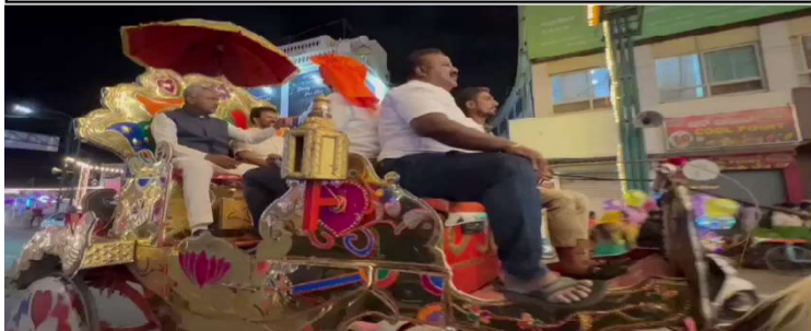
ಜಿಲ್ಲಾ ಉಸ್ತುವಾರಿ ಸಚಿವರು ಟಾಂಗಾ ಗಾಡಿಯ ಮೂಲಕ ದೀಪಾಲಂಕಾರವನ್ನು ವೀಕ್ಷಿಸಿದರು.