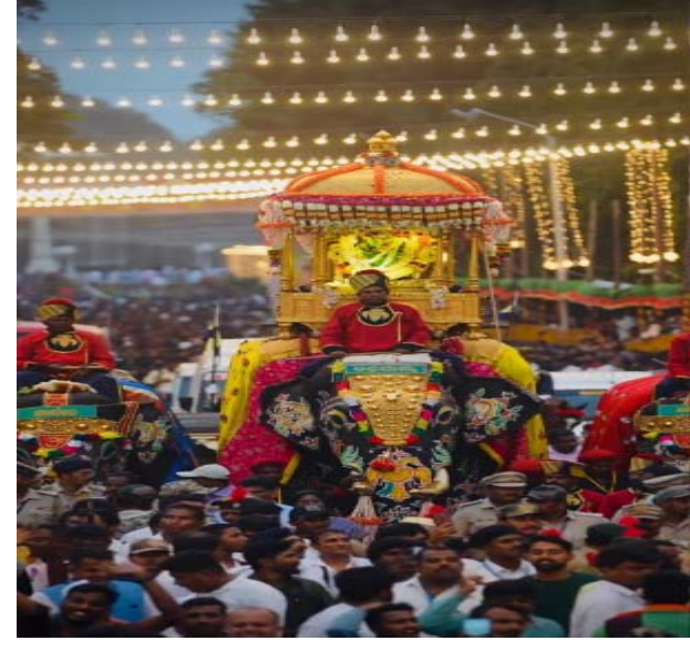
ಅಂಬಾರಿ ಹೊತ್ತ ಅಭಿಮನ್ಯು

ಮೈಸೂರು, ಅ.5- ದಸರಾ ಮಹೋತ್ಸವದ ಇತಿಹಾಸದಲ್ಲಿ ಇದೆ ಮೊಟ್ಟ ಮೊದಲ ಬಾರಿಗೆ ಜಂಬೂ ಸವಾರಿ ಮೆರವಣಿಗೆಯು ವರ್ಣರಂಜಿತ ದೀಪಾಲಂಕಾರದ ನಡುವೆ ಸಾಗಿ ಬಂದಿದೆ. ಹಿಂದೆ ಯಾವ ವರ್ಷವೂ ಕೂಡ ಜಂಬೂಸವಾರಿಯೂ ದೀಪ ಅಲಂಕಾರ ನಡುವೆ ಸಾಗಿದಿಲ್ಲ. ಈ ಬಾರಿ ಪುಷ್ಪಾರ್ಚನೆ ಲಗ್ನ ಬಹಳ ತಡವಾಗಿದ್ದರಿಂದ ದೀಪಾಲಂಕಾರಗಳ ನಡುವೆ ಅಭಿಮನ್ಯು ಚಿನ್ನದ ಅಂಬಾರಿಯನ್ನು ಹೊತ್ತಿ ರಾಜ ಮಾರ್ಗದ ಮೂಲಕ ಸಾಗಿದರು ಈ ಸಮಯದಲ್ಲಿ ಸಾವಿರಾರು ಜನರು ಅಮೃತವರ ದರ್ಶನ ಪಡೆದು ಕಣ್ಮಂಚಿಕೊಂಡರು. ಇಂದು ಚಿನ್ನದ ಅಂಬಾರಿಯಲ್ಲಿ ಆಸೀನಳಾಗಿರುವ ಚಾಮುಂಡೇಶ್ವರಿ