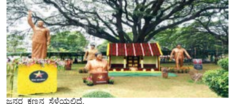
ಜನರ ಕಣ್ಣಿನ ಸೆಳೆಯಲಿದೆ.