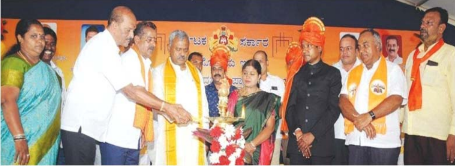
ದಸರಾ ವಸ್ತು ಪ್ರದರ್ಶನಕ್ಕೆ ಮೈಸೂರು ಉಸ್ತುವಾರಿ ಸಚಿವರು ಹಾಗೂ ಇತರ ಗಣ್ಯರಿಂದ ಚಾಲನೆ

ಮೈಸೂರು: ಮೈಸೂರು ದಸರಾ ವಿಶೇಷ ಆಕರ್ಷಣೀಯ ಸ್ಥಾನವಾದ ವಸ್ತು ಪ್ರದರ್ಶನವು ಸೆಪ್ಟೆಂಬರ್ 26ರಂದು ಜಿಲ್ಲಾ ಉಸ್ತುವಾರಿ ಸಚಿವ ಎಸ್ ಟಿ ಸೋಮಶೇಖರ್ ರವರಿಂದ ಉದ್ಘಾಟನೆಗೊಂಡಿತು. ಕರ್ನಾಟಕ ವಸ್ತು ಪ್ರದರ್ಶನ ಪ್ರಾಧಿಕಾರ ಆವರಣದಲ್ಲಿ ಟೀಪ್ ಕತ್ತರಿಸಿ, ದೀಪ ಬೆಳಗಿಸುವ ಮೂಲಕ ದಸರಾ ವಸ್ತು ಪ್ರದರ್ಶನವನ್ನು ಚಾಲನೆ ನೀಡಿದರು. ಬಳಿಕ ಮಾತನಾಡಿದವರು, ಮೂರು ತಿಂಗಳ ಕಾಲ ನಡೆಯುವ ದಸರಾ ವಸ್ತು ಪ್ರದರ್ಶನಕ್ಕೆ ಚಾಲನೆ ನೀಡಿದ್ದು, ಹಿಂದೆಂದಿಗಿಂತಲೂ ಅಚ್ಚುಕಟ್ಟಾದ ವ್ಯವಸ್ಥೆ