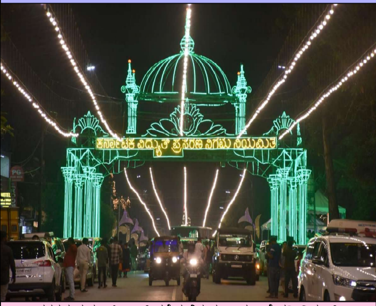
ನಗರದ ಸಯ್ಯಾಜಿ ರಾವ್ ರಸ್ತೆಯಲ್ಲಿರುವ ಚಾಮುಂಡೇಶ್ವರಿ ವಿದ್ಯುತ್ ಸರಬರಾಜು ಕಛೇರಿಯ ಬಳಿ ಕಂಗೊಳಿಸುತ್ತಿರುವ ದೀಪಾಲಂಕಾರ

ಮಾಡಿದ್ದಾರೆ. ಮೈಸೂರು ರಾತ್ರಿಯ ವೇಳೆ ದೀಪಗಳಿಂದ ಜಗಮಗಿಸುತ್ತಿದೆ. ವಿಶ್ವವಿಖ್ಯಾತ ಮೈಸೂರು ದಸರಾ ೨೦೨೨ರ ಅಂಗವಾಗಿ ಮೈಸೂರು ನಗರ ಸಂಚಾರ ಪೊಲೀಸ್ ನವರು ಜನರಿಗೆ ಶುಭ ಸುದ್ದಿಯೊಂದನ್ನು ನೀಡಿದ್ದಾರೆ. ಸಾರ್ವಜನಿಕರಿಗೆ ದೀಪಾಲಂಕಾರ ವೀಕ್ಷಣೆಗೆ ಅಡ್ಡಿಯಾಗದಂತೆ ಕೆಲ ವೃತ್ತಗಳಿಗೆ ಸೀಟರಿಂದ ಅ. ಉ ರವರೆಗೆ ರವರೆಗೆ ವಾಹನ ನಿರ್ಬಂಧ ವಿಧಿಸಲಾಗಿದೆ. ಅರಮನೆಯ ಸುತ್ತಮುತ್ತಲಿನ ಸ್ಥಳಗಳಲ್ಲಿ ಸಾರ್ವಜನಿಕರಿಗೆ ದೀಪಾಲಂಕಾರವನ್ನು ವೀಕ್ಷಣೆ ಮಾಡಲು ಪ್ರಮುಖ ಸರ್ಕಲ್‌ಗಳಲ್ಲಿ ವಾಹನ ಸಂಚಾರವನ್ನು ನಿಷೇಧ ಮಾಡಲಾಗಿದೆ. ಸುತ್ತಮುತ್ತಲು ಸುಮಾರು ೧೨೪ ಕಿ.ಮೀ ಸುತ್ತಲಿನ ವೃತ್ತಗಳಲ್ಲಿ ವಿಶೇಷ ದೀಪಾಲಂಕಾರ ಕಂಗೊಳಿಸುತ್ತಿದೆ. ಇತ್ತೀಚೆಗೆ ನಿಧನರಾದ ಪವರ್ ಸ್ಟಾರ್ ಪುನೀತ್ ರಾಜಕುಮಾರ್ ಸೇರಿದಂತೆ ೨೮ ವಿವಿಧ ಬಗೆಯ ಪ್ರತಿ ಕೃತಿಗಳನ್ನು ದಸರಾ ದೀಪಾಲಂಕಾರದಲ್ಲಿ ಪ್ರಮುಖ ಸ್ಥಳಗಳಲ್ಲಿ ನಿರ್ಮಿಸಲಾಗಿದೆ. ಪವರ್ ಸ್ಟಾರ್ ರಾತ್ರಿ ೨ ಗಂಟೆಯಿಂದ ೧೧ವಿಂಟು ಅವಕಾಶ ಇದೆ. ಪ್ರತಿದಿನ ರಾತ್ರಿ ೨ ಗಂಟೆಯಿಂದ ೧೧ ರವರೆಗೆ ವೀಕ್ಷಣೆಗೆ ಜನಸಾಗರವೇ ಹರಿದುಬಂದಿದೆ.