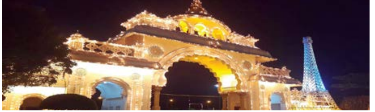
ಪ್ರೇಕ್ಷಕರ ಮನ ಸೆಳೆದಿತು ವಸ್ತು ಪ್ರದರ್ಶನ

ಮಾಹಿತಿ ನೀಡುವ ಸಲುವಾಗಿ ಡಿಜಿಟಲ್ ಆಪ್ ಸೌಲಭ್ಯ ಕಲ್ಪಿಸಲಾಗಿದೆ. ಟಿಕೆಟ್ ಕೌಂಟರ್ ಬಳಿ ಆಪ್ ಡೌನ್‌ಲೋಡ್ ಮಾಡಿಕೊಂಡು ವಸ್ತುಪ್ರದರ್ಶನದ ಸಂಪೂರ್ಣ ನಕ್ಷೆ ಹಾಗೂ ಮಾಹಿತಿಯನ್ನು ಸಾರ್ವಜನಿಕರಿಗೆ ತಿಳಿಸಲು ಕ್ರಮ ವಹಿಸಲಾಗುತ್ತದೆ. ವಯಸ್ಕರಿಗೆ 30, ಮಕ್ಕಳಿಗೆ 20 ರೂ ಪ್ರವೇಶದರ ನಿಗದಿಪಡಿಸಲಾಗಿದೆ.ಅರಣ್ಯ