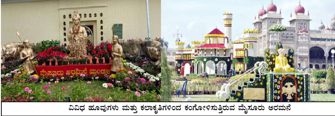
ವಿವಿಧ ಹೂವುಗಳು ಮತ್ತು ಕಲಾಕೃತಿಗಳಿಂದ ಕಂಗೊಳಿಸುತ್ತಿರುವ ಮೈಸೂರು ಅರಮನೆ

ದಸರಾ ಎಂದ ತಕ್ಷಣ ನಮಗೆ ಮೊದಲು ನೆನಪಾಗುವುದು ವಿಶ್ವವಿಖ್ಯಾತ ಅಂಬಾ ವಿಲಾಸ ಅರಮನೆ. ಅರಮನೆ ಮುಂಭಾಗದ ಉದ್ಯಾನದಲ್ಲಿ ಸೃಷ್ಟಿಯಾಗಿರುವ ಪುಷ್ಪ ಲೋಕದಲ್ಲಿ ಹಲವು ಮಹಾಮಹನೀಯರಿಗೆ ಪ್ರತಿ ಕೃತಿಗಳ ಮೂಲಕ ಪುಷ್ಪ ನಮನ ಸಲ್ಲಿಸಿದ್ದಾರೆ. ಮೈಸೂರು ಅರಮನೆ ಮಂಡಳಿ ವತಿಯಿಂದ ಏರ್ಪಡಿಸಿರುವ ಪಲಪುಷ್ಪ ಪ್ರದರ್ಶನ ಈ ಬಾರಿ ವಿಶೇಷ ಹಾಗೂ ಅತ್ಯಾಕರ್ಷಣೀಯವಾಗಿದೆ. ಹೂಗಳಿಂದ ನಿರ್ಮಿಸಿರುವ ಸ್ವಾಗತ ಕಮಾನು ಮೂಲಕ ಉದ್ಯಾನಕ್ಕೆ ಹೆಜ್ಜೆ ಇಟ್ಟರೆ ಬಣ್ಣ ಬಣ್ಣದ ಪುಷ್ಪಲೋಕ ತೆರೆದುಕೊಳ್ಳುತ್ತದೆ. ಔಷಧಿಯು ಗಿಡಗಳು ಸೇರಿದಂತೆ ಎಲ್ಲಾ ರೀತಿಯ ಸಸ್ಯಗಳನ್ನು ಅಚ್ಚುಕಟ್ಟಾಗಿ ಜೋಡಿಸಲಾಗಿದೆ. ಒಂದು ಸುತ್ತು ಹಾಕುವಷ್ಟರಲ್ಲಿ ಕಣ್ಣಿನ ಉಲ್ಲಾಸ ತವಾಗುತ್ತದೆ ಇನ್ನು ಫಲಪುಷ್ಪ