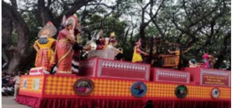
ಚಿತ್ರ ಕೃಪೆ-ಪ್ರೀತಿಕ ಕಾಂಚನ್