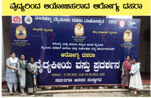
ಆರೋಗ್ಯ ದಸರಾದಲ್ಲಿ ಉಪಸ್ಥಿತರಾದ ವೈದ್ಯರು

ಮೈಸೂರು ಅ.27: ನಾಡಹಬ್ಬ ಮೈಸೂರು ದಸರಾ ಮಹೋತ್ಸವದ ಅಂಗವಾಗಿ ಮೈಸೂರು ಮೆಡಿಕಲ್ ಕಾಲೇಜಿನ ಸಂಶೋಧನಾ ಸಂಸ್ಥೆಯಲ್ಲಿ ಆರೋಗ್ಯ ದಸರಾ ವೈದ್ಯಕೀಯ ವಸ್ತು ಪ್ರದರ್ಶನವನ್ನು ಏರ್ಪಡಿಸಿದ್ದು, ಇಲ್ಲಿ ವೈದ್ಯಕೀಯ ಕ್ಷೇತ್ರದ ಕೆಲವೊಂದು ಕುತೂಹಲಕಾರಿ ವಿಷಯಗಳ ಬಗ್ಗೆ ಸಾರ್ವಜನಿಕರಿಗೆ ತಿಳಿಸಿಕೊಡಲಾಯಿತು. ಮಾನವನ ದೇಹದ ಅಂಗಾಂಗಗಳು, ಮೂಳೆಗಳು, ತಲೆ ಬುರುಡೆ ಸೇರಿದಂತೆ ವಿವಿಧ ರೀತಿಯ ಪಳೆಯುಳಿಕೆಗಳನ್ನು ಕಾಣಬಹುದಾಗಿದೆ. ಹಾಗೆ ಭ್ರೂಣದಿಂದ ಜನನವರೆಗೆ ಮಗುವಿನ ಬೆಳವಣಿಗೆಯ ಹಂತಗಳನ್ನು ರಾಸಾಯನಿಕಗಳನ್ನು ಬಳಸಿಕೊಂಡು ಸಂರಕ್ಷಿಸಲ್ಪಟ್ಟ ನೈಜ ಮಗುವಿನ ದೇಹಗಳನ್ನು ನೋಡಬಹುದು ಸತ್ತ ಮನುಷ್ಯರು ತಮ್ಮ ದೇಹವನ್ನು ವೈದ್ಯಕೀಯ