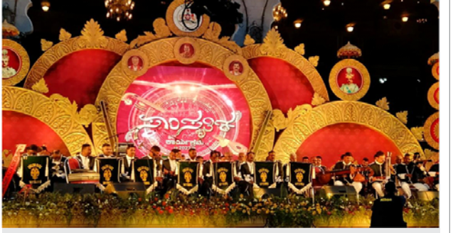
ವಾದ್ಯ ಬೃಂದಾವನ ನುಡಿಸುತ್ತಿರುವ ಪೊಲೀಸ್ ಬ್ಯಾಂಡ್ ತಂಡ