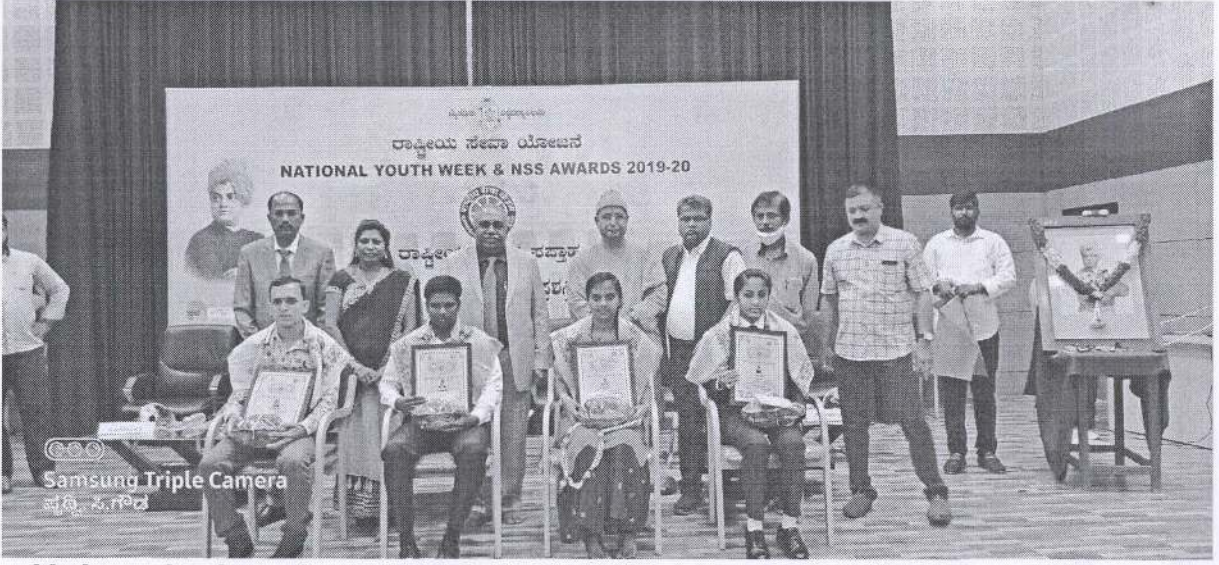
University Level and NSS U. K. Subbaraya char Memorial Awards