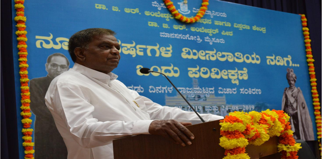
Shree V. Srinivasa Prasad, Member of Parliament, Former, Union and State Minister