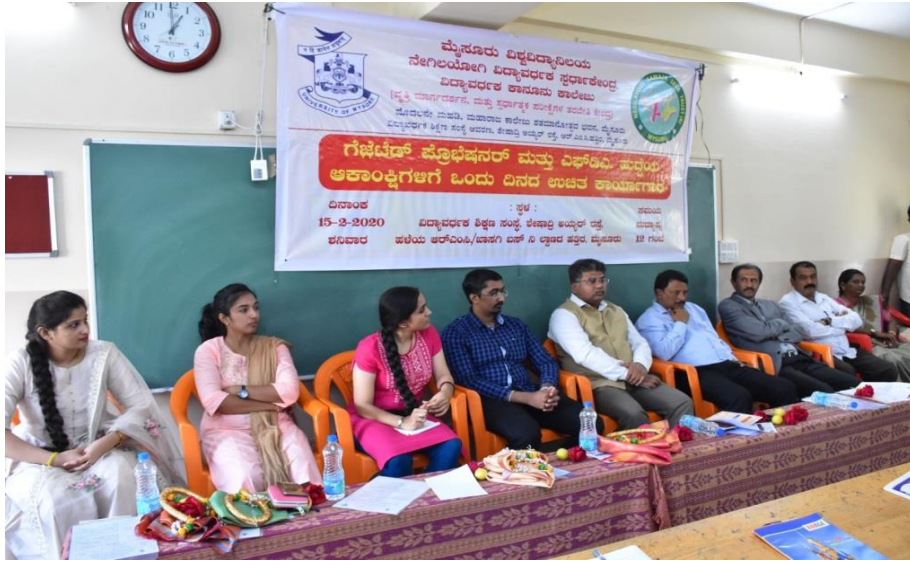
Chief Guests present during the workshop.