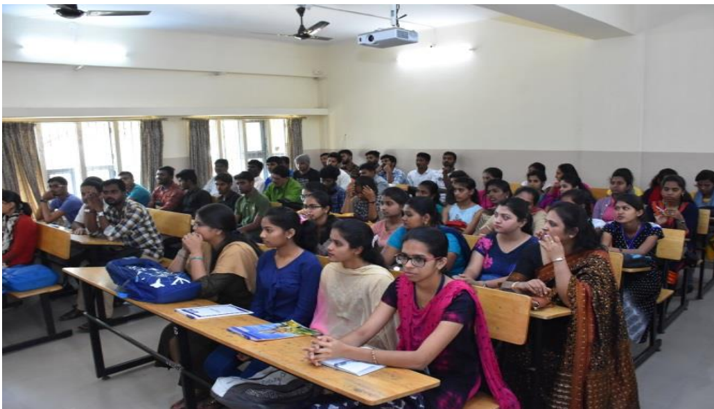
Participants present during the programme