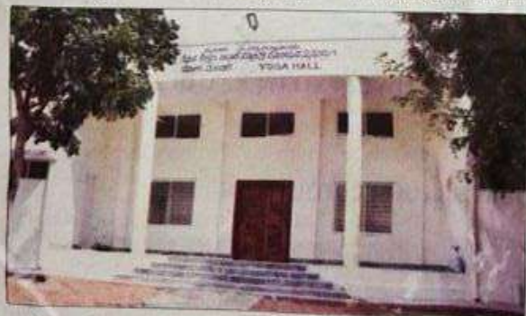
Mysore Varsity's newly-built Yoga Hall at the Sports Pavilion.

Dr. Krishnaiah: To begin with, the Yoga Centre will function from 6.30 am to 8.30 am and again from 4 pm to 7 pm. More batches will be started if more number of persons enrol their names. The Yoga Hall is likely to be inaugurated formally on Dec. 4. Money is not important for the Varsity but what is important is service to people through imparting training in yoga. It is a gift to the people of Mysuru from the UoM during the pandemic.