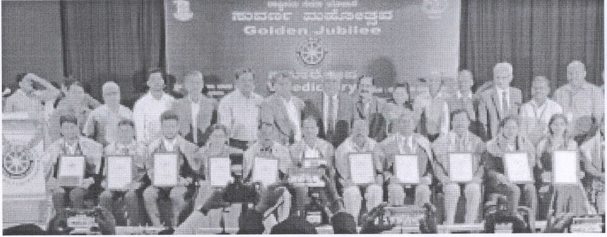
University Level NSS Awards for Best Units, University Level NSS Awards for Best Unit, Best Programme officers, and University Level NSS Awards for Volunteers & Best Volunteer UKS Award.

Handwritten signature in green ink ವಿಶ್ವಕೃಷಿ ಸಂಯೋಜನಾಧಿಕಾರಿಗಳು ರಾಷ್ಟ್ರೀಯ ಸೇವಾ ಯೋಜನೆ ಎಸ್.ಎಸ್.ಎಸ್. ಭವನ ಸಾಹುಕಾರ ಚಿನ್ನಯ್ಯ ರಸ್ತೆ ಸರಸ್ವತಿಪುರಂ ಪೊಲಿಸ್ ಠಾಣೆ ಎದುರು ಸರಸ್ವತಿಪುರಂ, ಮೈಸೂರು - 09